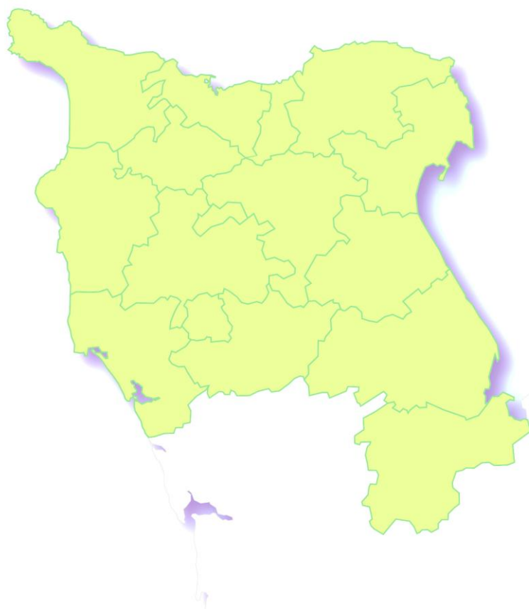
Le Pays du Cotentin